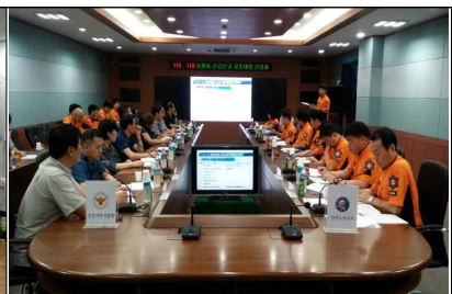
관계기관 협업체계 확립