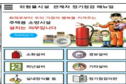
점검 매뉴얼 앱(App) 개발