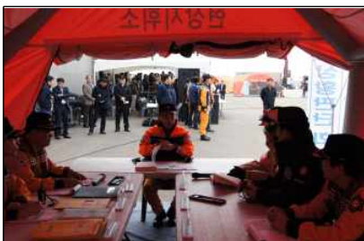
맞춤형 긴급구조훈련 실시