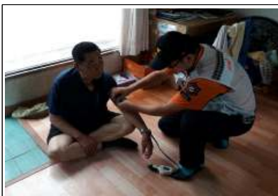
고령자 등 취약계층 기초건강 체크