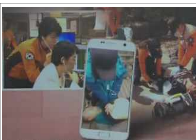
영상 의료상담 제공