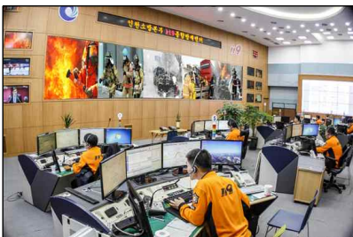
선제적 119종합상황실 운영