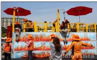
대규모 안전체험 행사