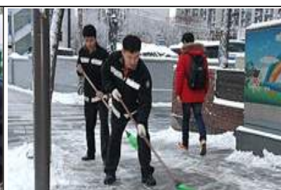
제설작업으로 주민 통행장애 개선