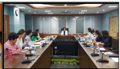
여성공무원 소통 활성화