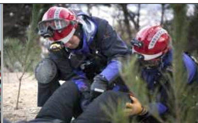
액션캠 활용 현장활동 촬영