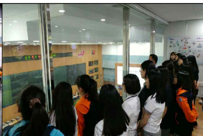
생생 119상황체험실 운영