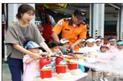
재해약자 교육·훈련 지원

○ 소방안전문화 확산을 위한 소통공간(SNS) 운영 : 우수 아이디어 실시간 공유