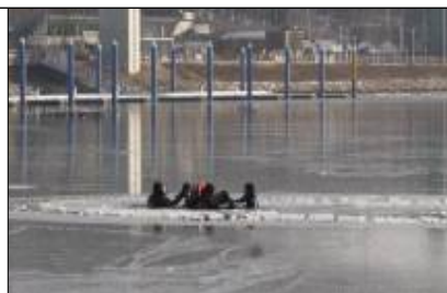
사고유형별 구조역량 강화