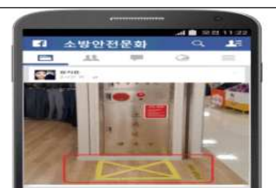
아이디어 공유 : 소화전 앞 적치 금지