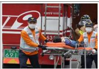
도서지역 펌블런스 확대 운영