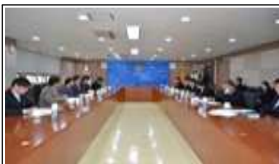
청렴소방정책 자문단 운영