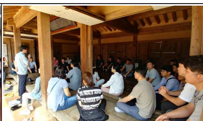
역사속 청렴문화 체험