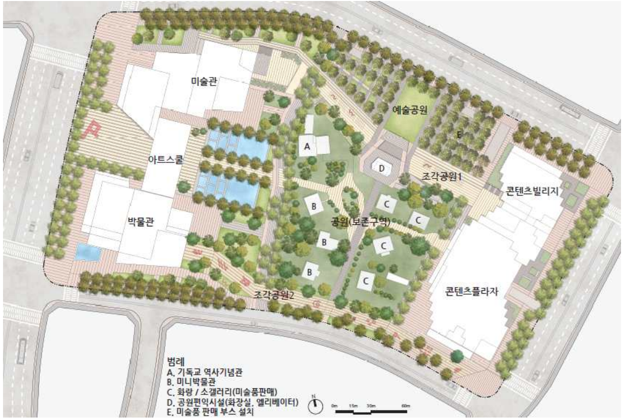
< 배치도 >