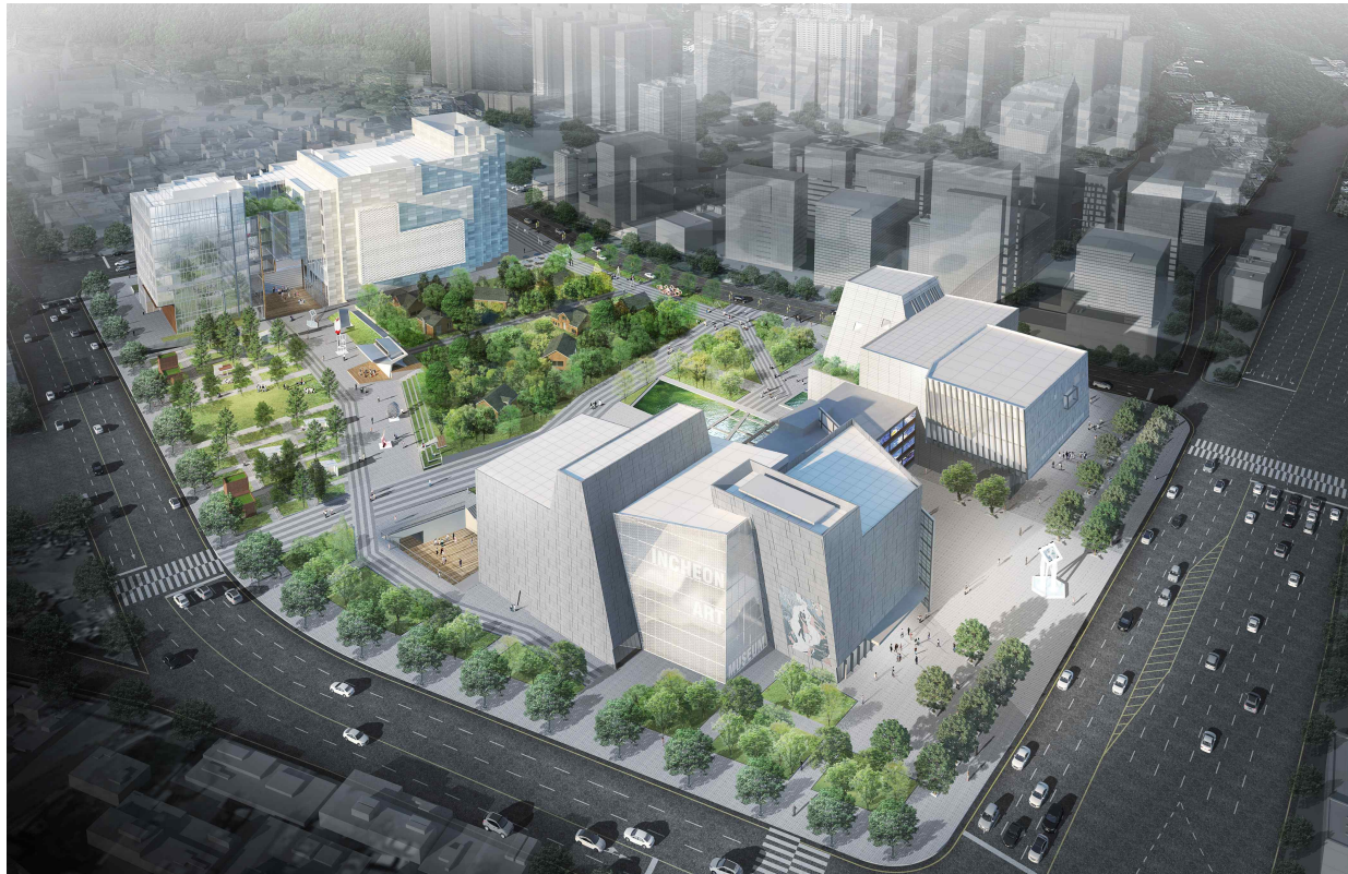
< 조감도 >