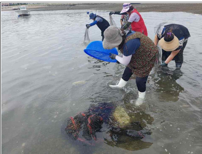
민꽃게 치게 방류