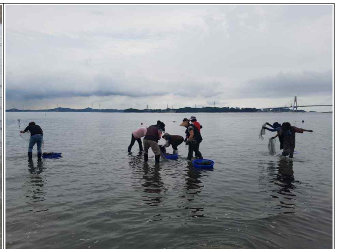
민꽃게 치게 방류