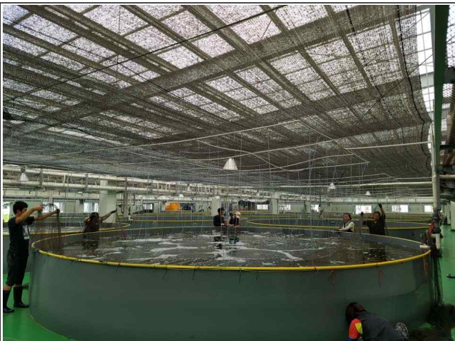
공식 방지망 제거