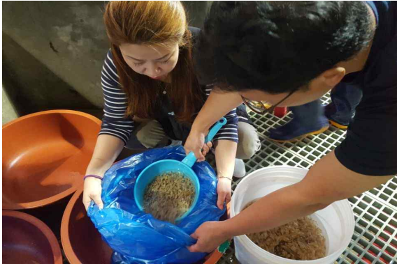
어린개불 채집 작업