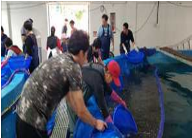
조피볼락 치어 채포 작업