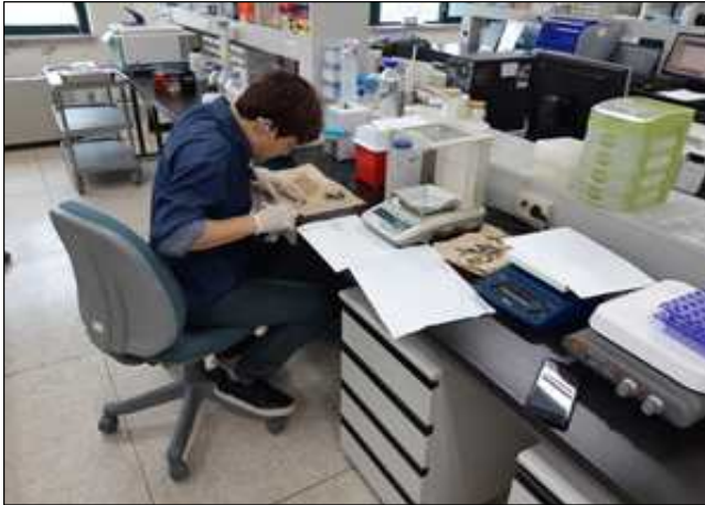
조피볼락 치어 무게 측정