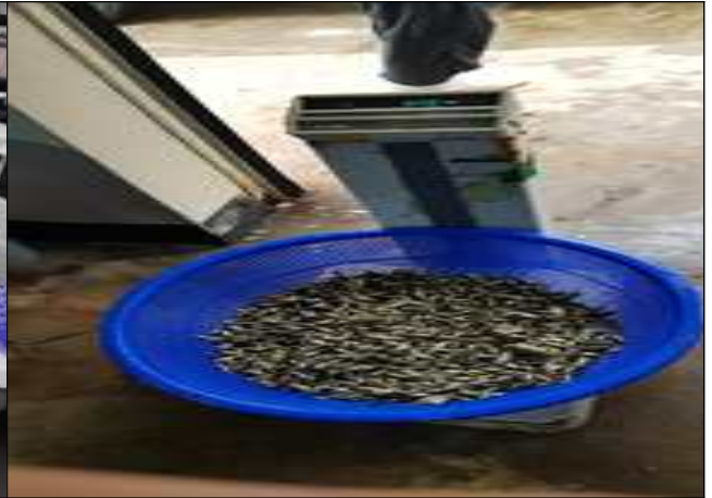
조피볼락 치어 무게 측정