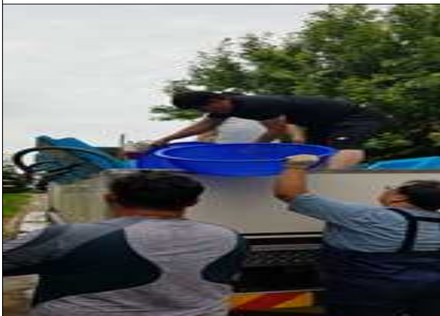
조피볼락 치어 상차