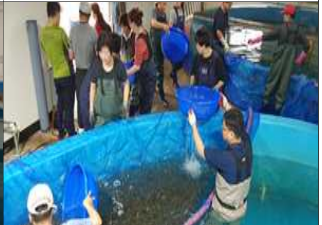
조피볼락 치어 채포 작업