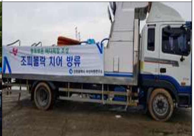
조피볼락 치어 상차