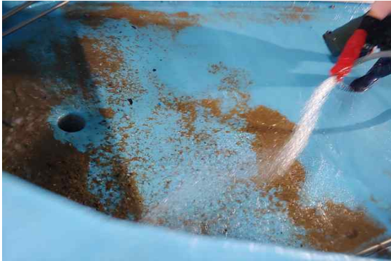
어린개불 채집 작업