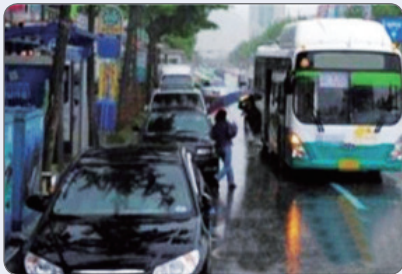
도로 한복판에서 승·하차하면서 교통사고 위험 및 뒤따르는 차들의 주행을 막아 2차 교통사고 야기