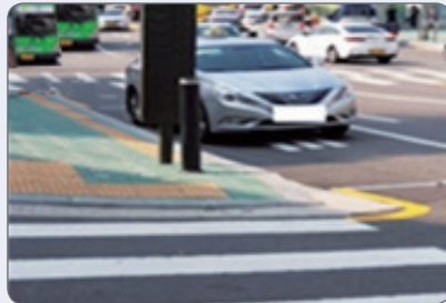
교차로 모퉁이 불법 주·정차는 모퉁이를 도는 운전자의 시야를 방해해 보행자의 안전을 위협