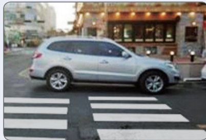
횡단보도를 가로막은 불법 주·정차 차량으로 보행자들이 차도를 이용하게 되어 교통사고 위험