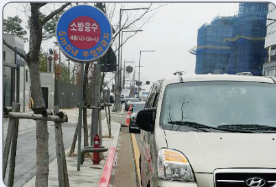
화재진압 골든타임(최초 발화 후 8분)이 지연되어 화재 사망자 증가 및 대규모 재산 피해 발생