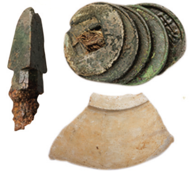
» 인천 운북동유적 출토 유물

한반도 중서부 지역에서는 영역별로 다양한 물질문화의 흔적을 남기고 있다. 이들 세력의 정체성과 백제국과의 관계설정이 앞으로 풀어야 할 숙제이다. 한반도 남북부지역 뿐만 아니라 중국의 영향을 받은 출토 유물들은 타지역과의 교류를 통해 다양한 문물을 주고받았던 당시의 사정을 말해준다.