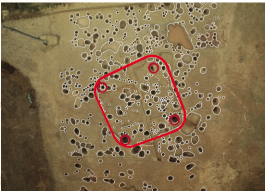
» 서해안 네모난 바닥 집터 (인천 운남동유적 집터)

인천지역에서는 네모난 바닥을 가진 집이 삼국시대 지어진 것으로 조사되었다. 네 귀퉁이에 기둥을 세운 집은 삼국시대 서해안에서 남해안으로 이어지는 해안가에 분포되고 있다. 이는 한반도 중부지역에서 보이는 출입구를 가진 여(呂)·철(凸)자형·육각형 집과는 다른 주거문화로 구별된다.