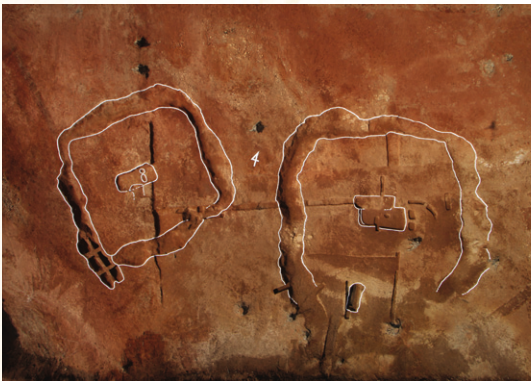
» 인천 중산동유적 흙무지무덤