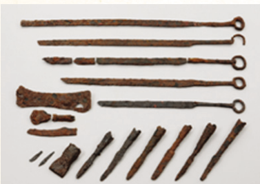
» 인천 연희동유적 출토 유물

한편 마한과 백제의 영토였던 인천과 인근인 한강 하류에서는 최근 삼국시대 초기에 해당하는 네모난 집터와 흙무지무덤들이 속속 발견되고 있다. 특히 한강 하류의 흙무지무덤에서는 인천 경기지역에서 드문 세형동검과 부여지방에서 확인된 것과 동일한 금 귀걸이가 출토되어 세간의 관심을 얻었다. 이 유적들에서 살았던 사람들은 백제국과 어떤 관계였을까?