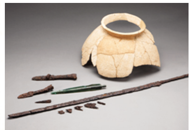
» 김포 운양동유적 27호 흙무지무덤 출토 유물