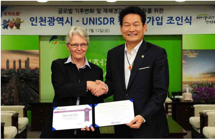
2013.07.12. 인천광역시, UN ISDR로부터 도시캠페인 국내 첫 승인

한국인의 도시캠페인에 대한 열의는 계속된다: 주목할 만한 127개 한국 지방자치단체가 세계적으로 확산되고 있는 UNISDR의 기후변화와 재해에 강한 도시 만들기 캠페인에 참여하고 있다.