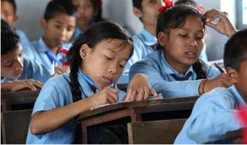
Schoolchildren in Pokhara, Nepal. 네팔 포카라의 어린학생들

GENEVA, 11 May 2015 - The death toll among Nepali schoolchildren would have been significant if the 7.8 magnitude earthquake had struck on a school day instead of a Saturday, the only day when schools are completely closed. This stroke of luck ensured there was no repetition of the thousands of deaths among schoolchildren which occurred as a result of major earthquakes in the last decade in China, Haiti and Pakistan.