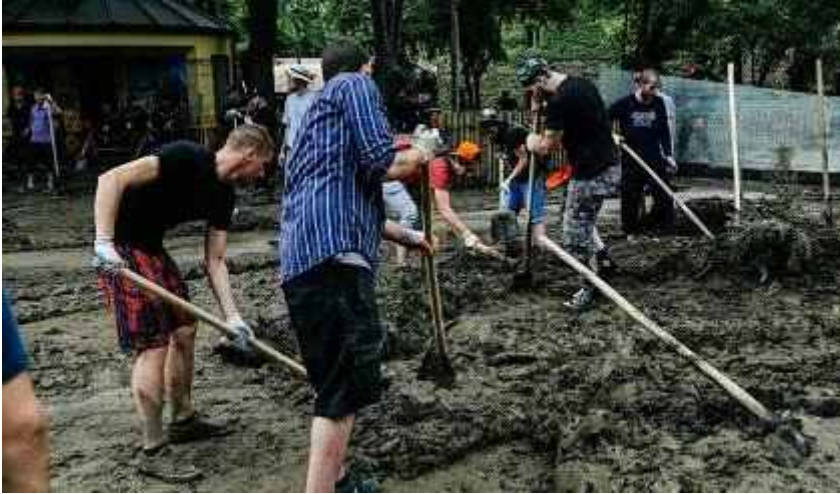
Volunteers cleaning up after last month's floods in Tbilisi, Georgia. 조지아 수도 트빌리시 지난 달 홍수이후 흙더미를 치우고 있는 자원봉사자들

TBLISI, 27 July 2015 – The city of Tbilisi is moving to strengthen its readiness to deal with natural and technological hazards while memories of last month's flash flooding remain fresh. 트빌리시, 2015.07.27. – 트빌리시는 지난 달 갑작스런 홍수가 머릿속에 생생하게 남아 있음에도 자연 및 기술 재해에 대처할 수 있는 역량을 강화하고 있다.