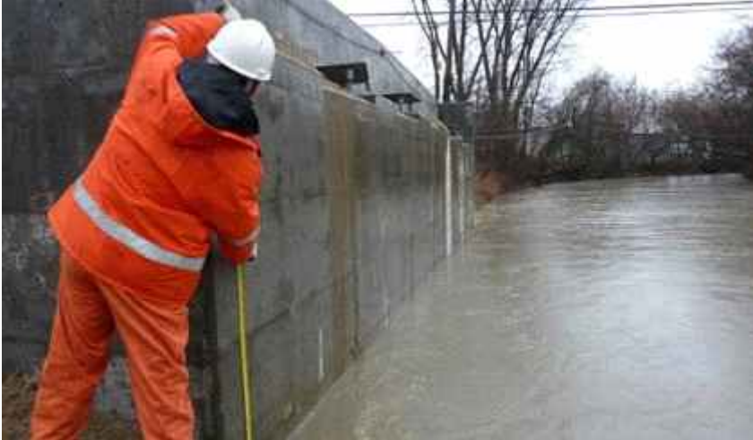
Reconstruction of a bridge after flooding.