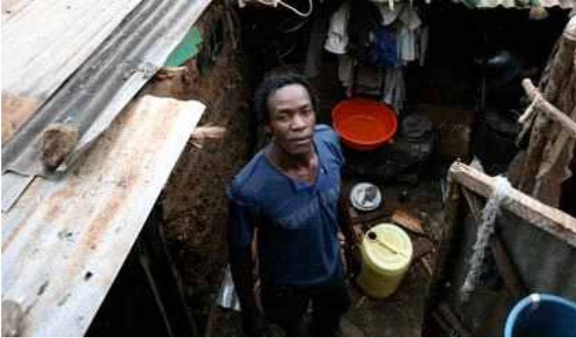
A man stands in front of his dwelling in Nairobi's Kibera slums. 한 남자가 나이로비 키베라 빈민가 그의 움막 앞에 서있다. By Ann Weru

NAIROBI, 21 May 2015 – Urban planning is a key element in disaster risk preparedness and community resilience in Africa, say experts.