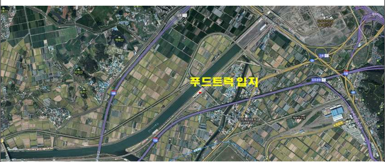
①-1. 별말교 ③~④ (1:25,000, 1:3,333)