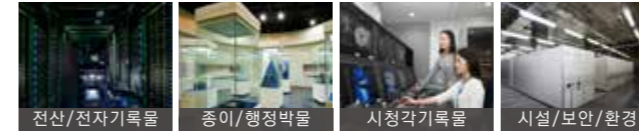
전산/전자기록물 | 종이/행정박물 | 시청각기록물 | 시설/보안/환경