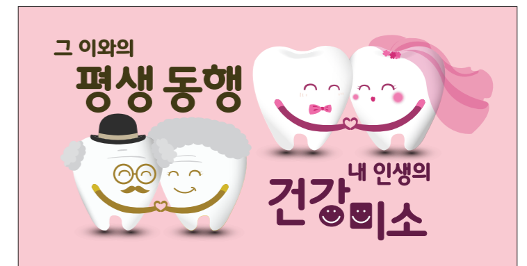
B TYPE 배경색

배경색 및 메인컬러 C=0 M=25 Y=7 K=0 별색 사용시 PANTONE 9284 C 2