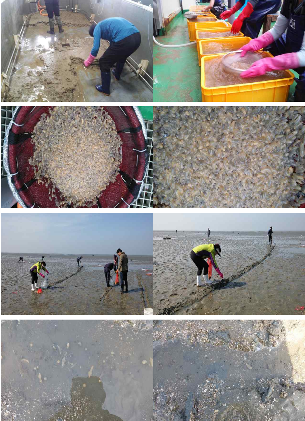
그림 6. 어린개불 채집 및 방류사진