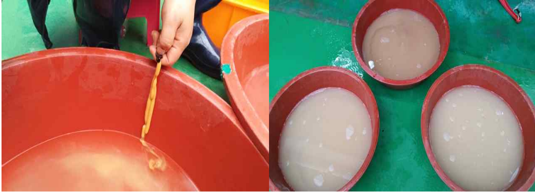
그림 2. 개불 인공수정(절개법) 작업

채란한 난은 약 5~10분간 정충을 부어 수정을 유도한 후 3~5회 세란을 실시하였고 채란량은 약 7,000만립 정도였으나, 자연산란이 아닌 절개법을 이용한 결과 난막이 없는 등 미성숙난이 많이 발생되어 세란 도중 50 \mu m 망에도 걸리지 않고 빠져나가는 경우가 많았고 수정률 또한 좋지 않았다.