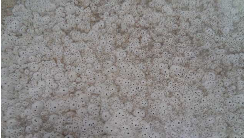
그림 4. 채묘 후 약 50일된 수조내 어린개불 서식지 구멍

채묘 후 20일 정도부터 어린개불이 잠입한 곳의 작은 구멍이 보이기 시작했으며 사육기간이 늘어남에 따라 구멍크기가 증가하고 구멍수도 증가하기 시작하였다.