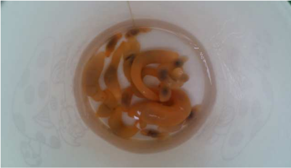
그림 5. 채묘 후 약 100일된 어린개불