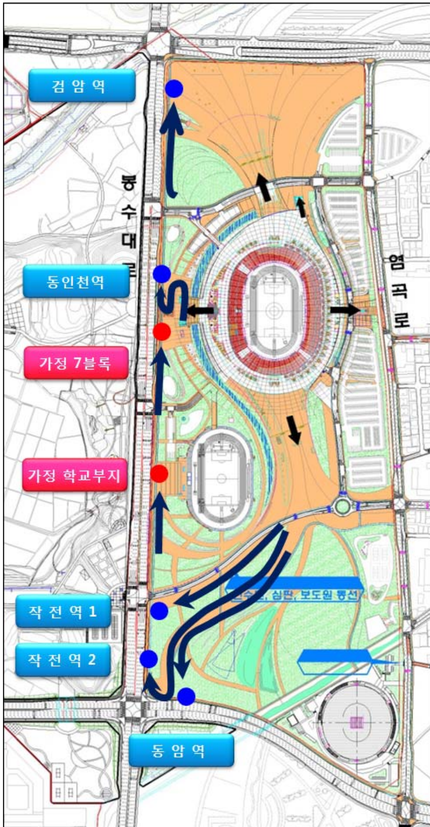
< 폐회식 주경기장 셔틀버스 승차장 위치 >